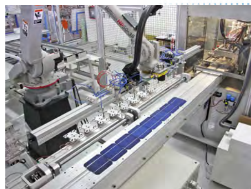
Volledig geautomatiseerde productiestraat